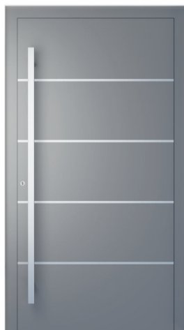
ME 002 oldal 2.18