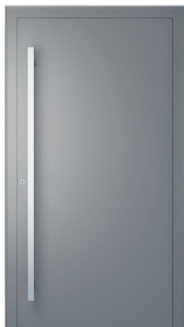
ME 000 oldal 2.18