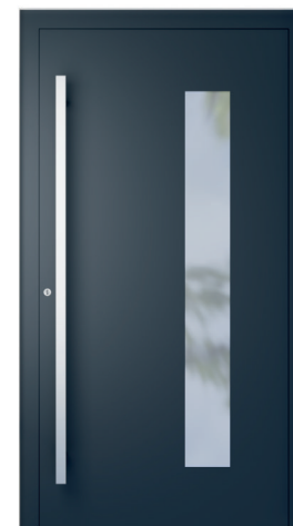
ME 004 oldal 2.19