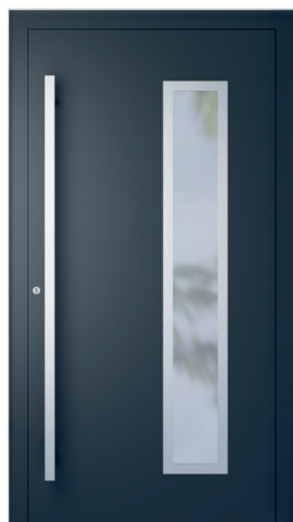
ME 004NX oldal 2.20