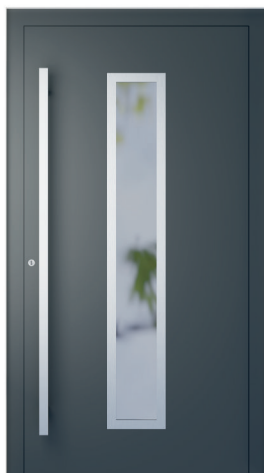
ME 001NX oldal 2.20