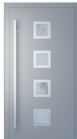
ME 003NX oldal 2.20