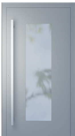
ME 008 oldal 2.19