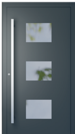
ME 021 oldal 2.19