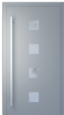
ME 003 oldal 2.18