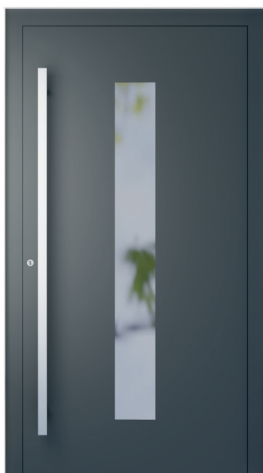
ME 001 oldal 2.18